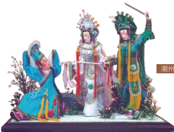
潮州花燈 —— 人物紗燈