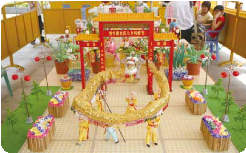
民間乞巧賽藝會上的參展作品

七夕節又有「乞巧節」「女兒節」等不同的叫法。七夕節在嶺南還有別樣的稱謂，如「七姐誕」「七娘誕」「擺七夕」「拜七娘」等。嶺南人對乞巧的追捧堪稱全國之最，儀式之鋪張、場面之熱鬧可與春節媲美。節日裡，女子們擺巧、鬥巧、拜仙、敬神、宴遊、歡唱，獨具一派南國風光。宋人劉克莊詩云：「粵人重巧夕，燈火到天明。」乞巧的風俗在清末民初，更是十分興盛。