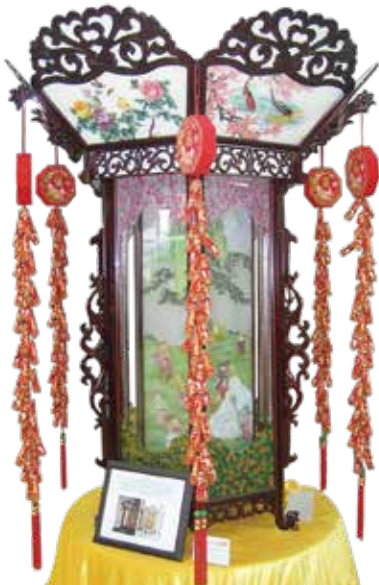
廣式紅木宮燈 —— 百變節日燈

元宵在早期節慶形成過程之時，只稱正月十五、正月半或月望，隋以後稱元夕或元夜。唐初受了道教的影響，又稱上元，唐末才偶稱元宵。自宋以後也稱燈夕。到了清朝，就另稱燈節。這一天晚上，民間要點燈盞，又稱「送燈盞」，以進行祭神祈福活動。