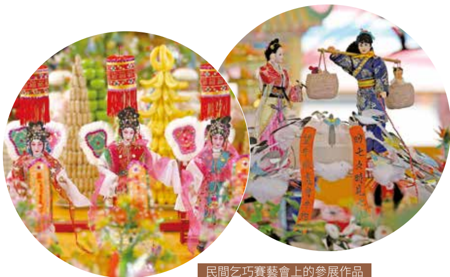
民間乞巧賽藝會上的參展作品

千年古俗唯有嶺南地區常盛不衰，與嶺南特有的文化密不可分。廣州俗語「第一遊波羅（波羅誕），第二娶老婆」，雖是戲說波羅誕，但羊城乞巧節也會出現「看物人稀看人多」的有趣場景。嶺南山川靈秀，充滿南國水鄉的浪漫情致，海外風情熏染，正是在這樣一個相對開放的社會環境中，女性更希望能夠通過一些節日來展示自由的個性，所以與七夕節日活動的全國性衰落相比，嶺南七夕活動的生命力依然旺盛。