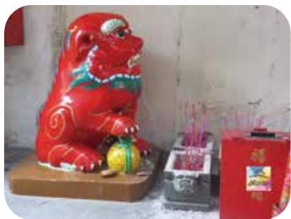
象徵吉祥如意的石獅