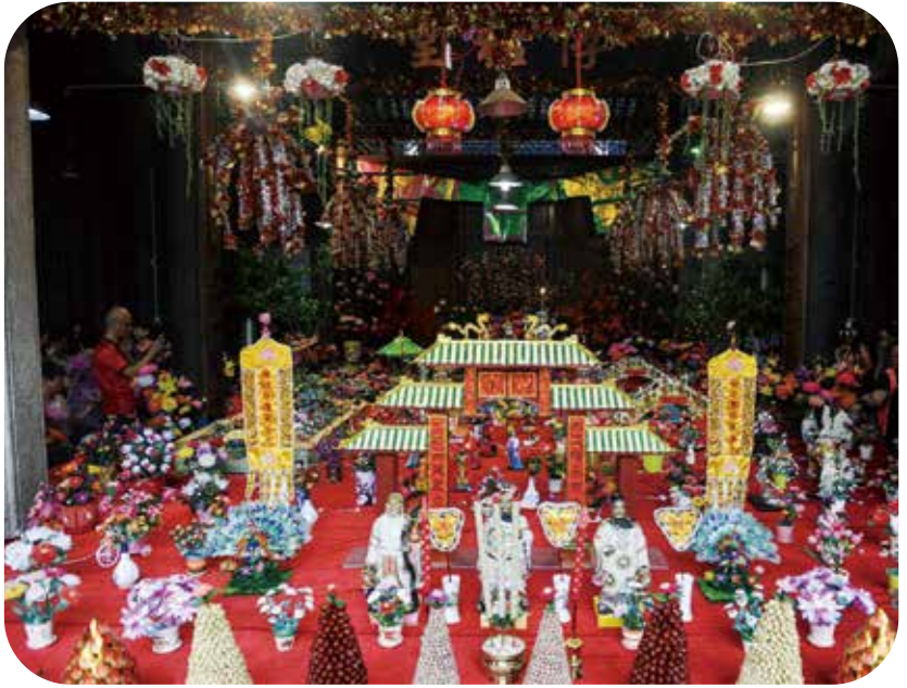
廣州車陂村「擺中元」