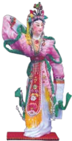
潮州花燈 —— 人物紗燈

元宵節，也叫「燈節」，在廣東地區，最重要的節目就是「玩燈」。「燈」與粵語的「丁」諧音，元宵燈會既有慶祝新春之意，也寄託了百姓祈求人丁興旺的美好願望。正月初九至正月十五期間，廣東各地都會舉辦燈節，各種具有地方特色的花燈大放異彩，如：廣式紅木宮燈、潮汕花燈、佛山彩燈、深圳沙頭角魚燈、江門龍鳳宮燈等。這些燈節以潮汕的遊花燈和佛山「行通濟」最為精彩。