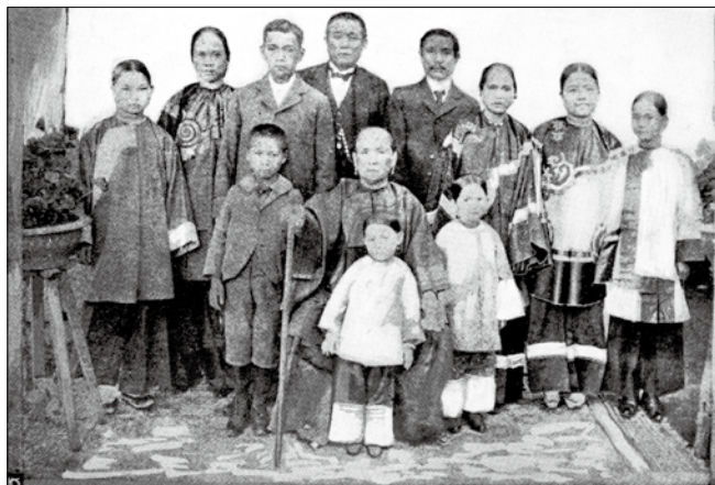
圖一 孫博士合家照（居中者為他的母親）