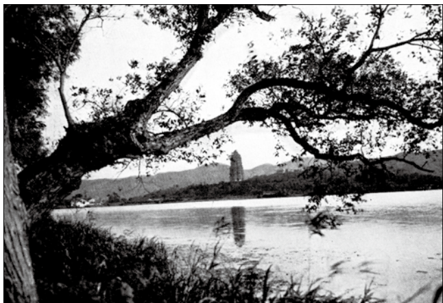
圖五 中山的童年只有對沉睡著的古老中國的記憶，這幅塔景正是那個時代的象徵

暖，雖然不必多穿衣服，但是常常更換的。中山因為尊重自己，每天到廟中學校裡去的時候，很有禮貌的穿了一雙氈底鞋線去。他歡喜用裝豆的枕頭，因為這種枕頭，既不像那套硬布的磚枕那麼生硬，又不像那裝藥的枕頭那麼柔軟。他那時雖是一個小孩，卻知道採用一種舒適的中和之道。